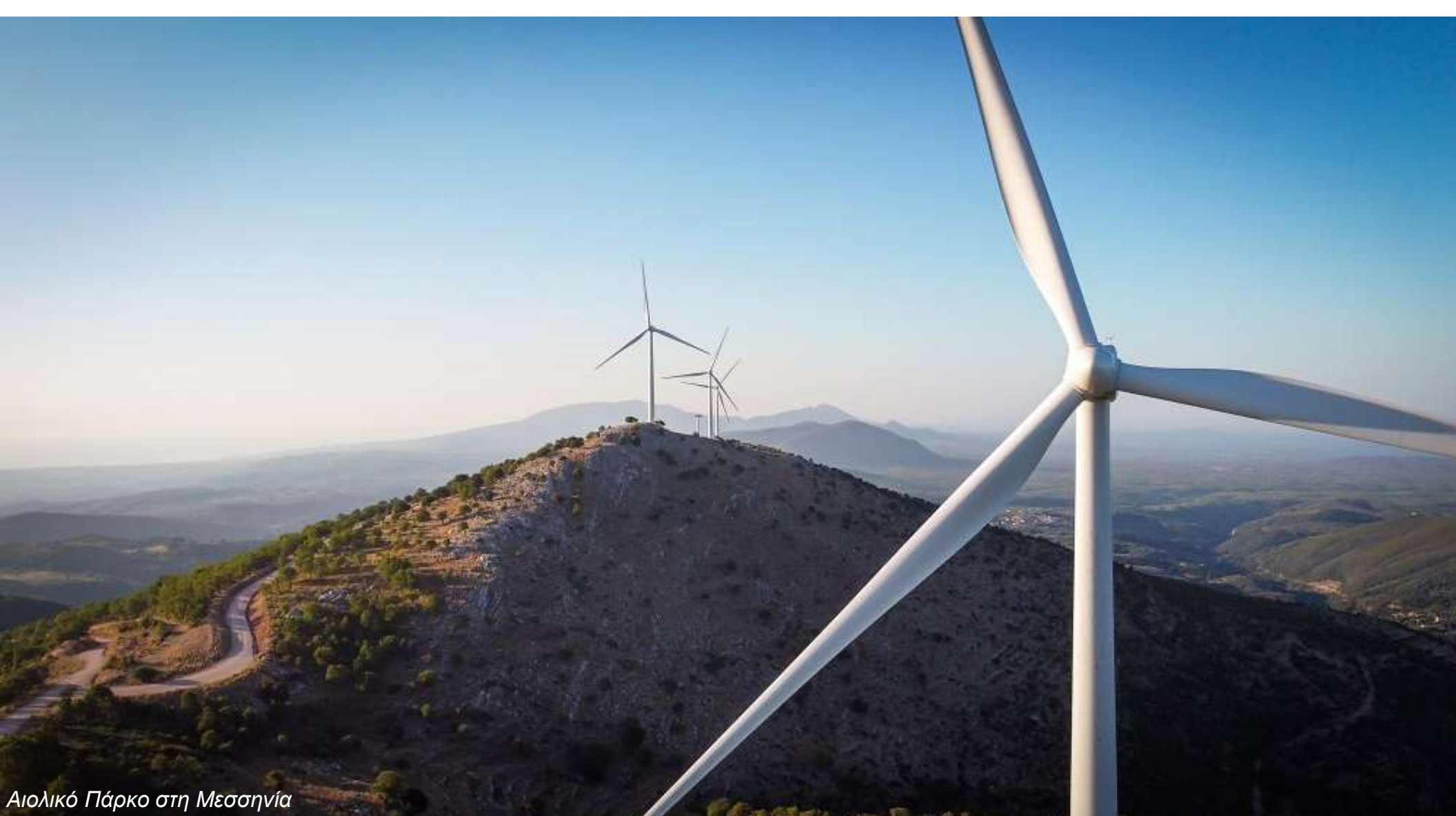
Αιολικό Πάρκο στη Μεσσηνία